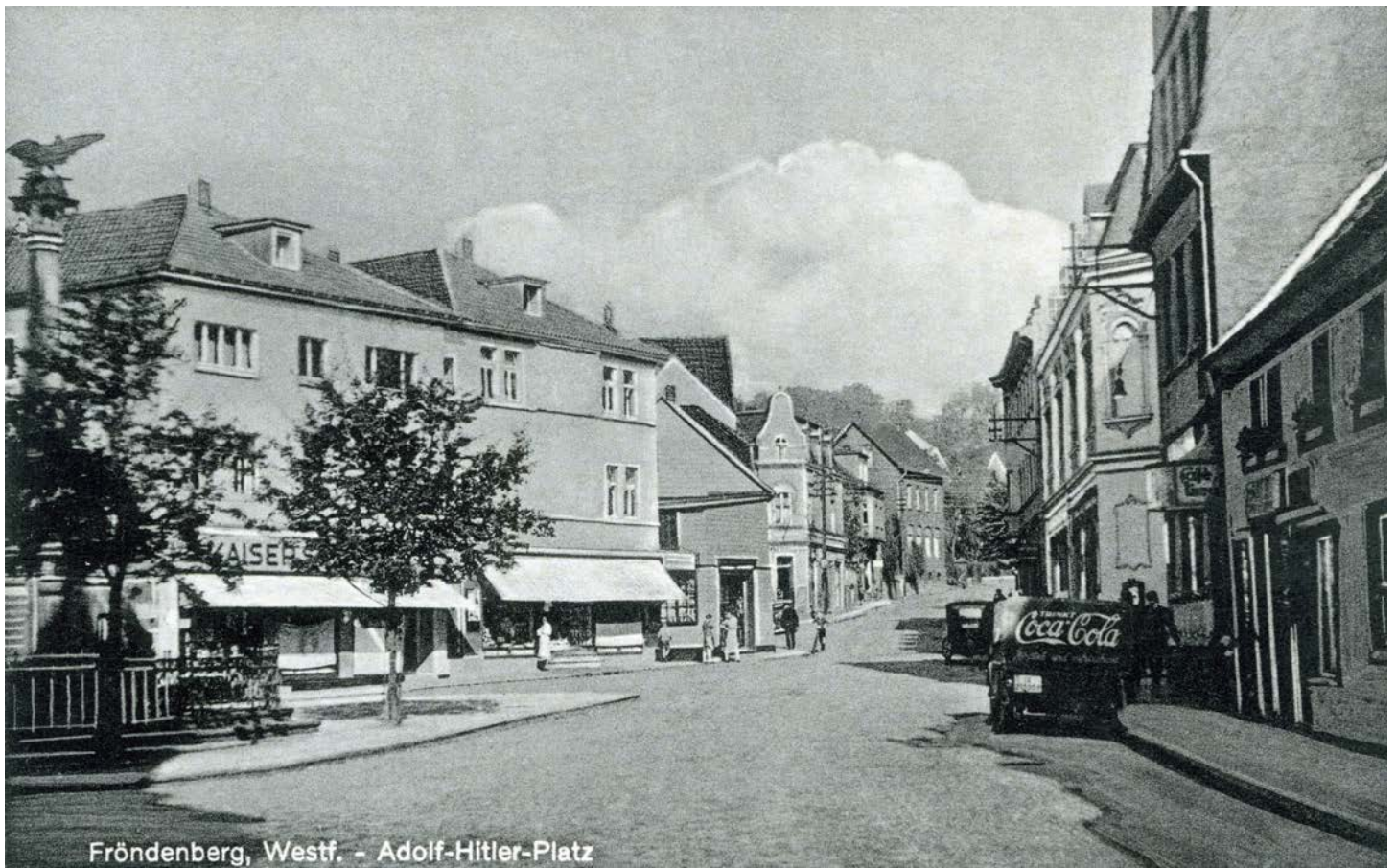
Fröndenberg, Westf. - Adolf-Hitler-Platz

Es erscheint uns heute kurios, dass es während der NS-Zeit in Fröndenberg Coca-Cola gegeben hat, aber diese alte Postkarte vom heutigen Marktplatz der Innenstadt beweist das Gegenteil. Dabei gab es Coca-Cola in Deutschland auch schon vor der NS-Zeit.